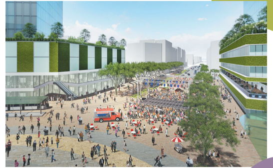
（池袋東口駅前広場の将来像）

区制90周年を迎えた豊島区が、100周年に向けて池袋をもっと居心地よく、歩いて楽しいまち（＝ウォークブルなまち）にしていきたい！ そんな未来へつなぐため、将来、池袋駅前広場化が計画されているグリーン大通り（東口）とアゼリア通り（西口）で区民・企業・行政と一緒に考え、参加し、訪れる人みんなが”人”中心の広場体験できる1日へ。